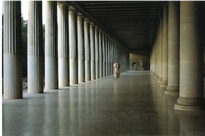
Rekonstruktion der stoa poikilê in Athen http://www.sandrashaw.com/images/AH1L24Stoa.jpg (7.12.2009)

Der Bereich der Logik lässt sich in zwei Teilbereiche einteilen: Dialektik und Rhetorik. Mit dieser Einteilung wurde die Rhetorik zum ersten Mal in der Philosophiegeschichte als ein Teil der Philosophie anerkannt, wenn gleich im praktischen Unterricht die Rhetorik ganz hinter die Dialektik trat. Für den Gründer der Schule Zenon selbst war es offensichtlich, dass sich im Sprechen und Denken der Logos offenbart.